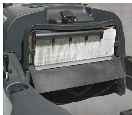
La SW750 è in grado di lavorare anche su superfici bagnate