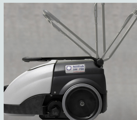
Impugnatura regolabile per il massimo comfort dell'operatore. Posizione "salva spazio" per il rimessaggio della macchina